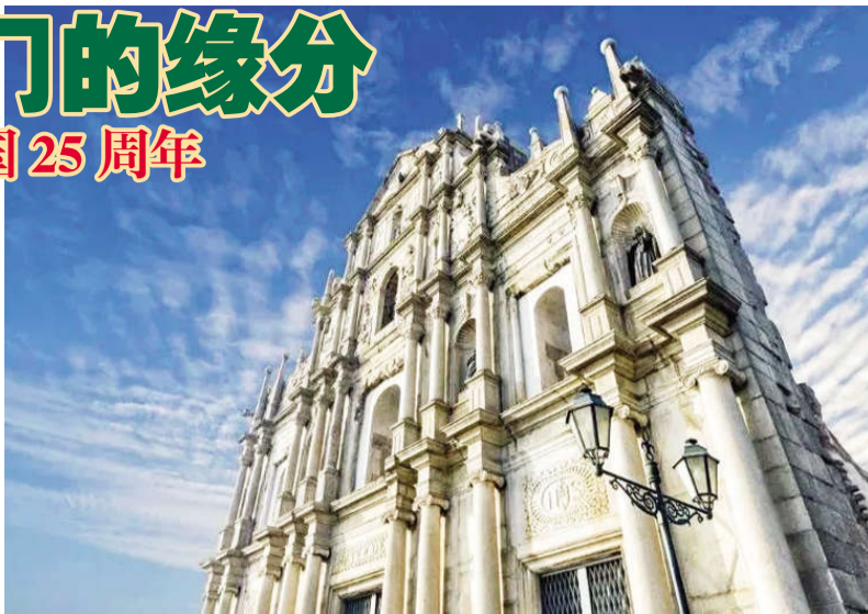
澳门大三巴牌坊

庆祝澳门回归祖国25周年大会暨澳门特别行政区第六届政府就职典礼12月20日上午在澳门东亚运动会体育馆隆重举行。国家主席习近平出席并发表重要讲话。他指出,澳门回归祖国25年来,具有澳门特色的“一国两制”实践取得巨大成功,澳门发生翻天覆地的变化,国际影响力大幅提升。他希望,新一届澳门特别行政区政府团结带领社会各界,抢抓机遇、锐意改革、担当作为,更好发挥“一国两制”制度优势,不断开创“一国两制”事业高质量发展新局面。