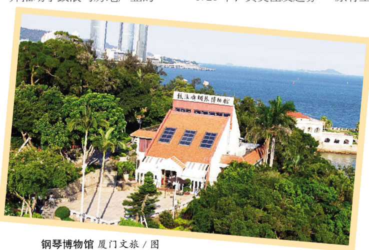
钢琴博物馆