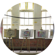
博爱医院旧址正在进行修缮