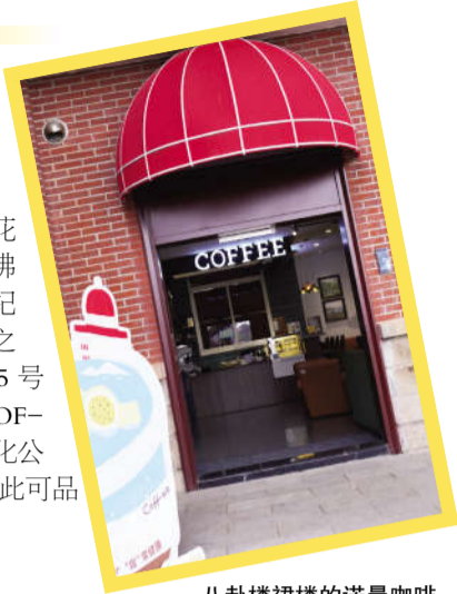
八卦楼裙楼的诺曼咖啡

鼓海峡两岸美景，时不时还能听见悠扬的风琴演奏。来到莫奈花园咖啡馆，仿佛置身于19世纪欧洲的庭院之中。鼓新路25号的GUREE COFFEE，就在淘化公司旧址旁，在此可品饮旧时光。