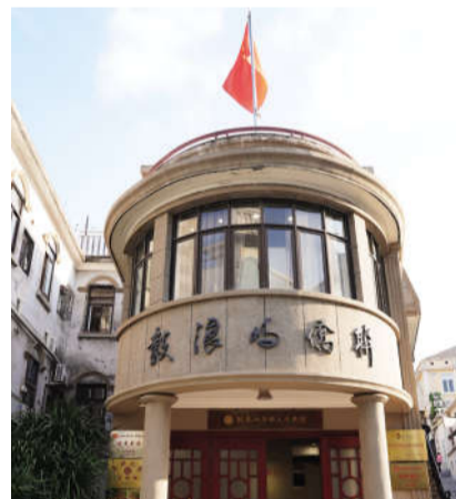
鼓浪屿华侨文化展馆

几经周折后，“商办厦门电话股份有限公司”于1933年正式成立，装机数达400门，可接通厦鼓和漳州、海澄一带，大大改善了鼓浪屿及闽南其他地区的通讯条件。