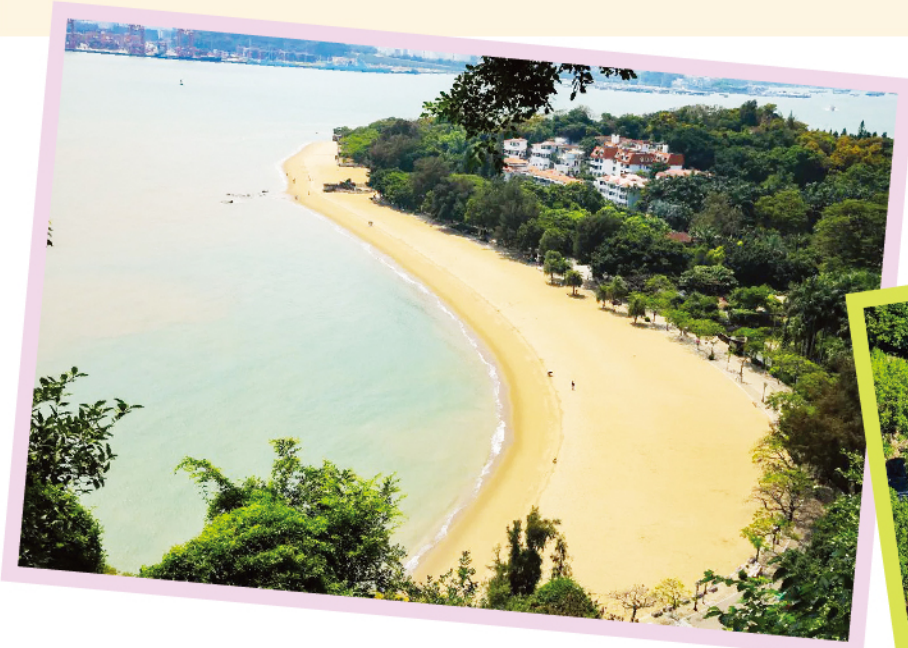
傳說中的“鼓浪石”在這

美華沙灘是鼓浪嶼三大海灘之一，位於鷄山路的盡頭，地處鼓浪嶼西南面，這裏灘緩浪平、沙粒柔軟。從前，當海浪向美華沙灘歡呼而來，沙灘上的“鼓浪石”以如鼓之聲迎接。