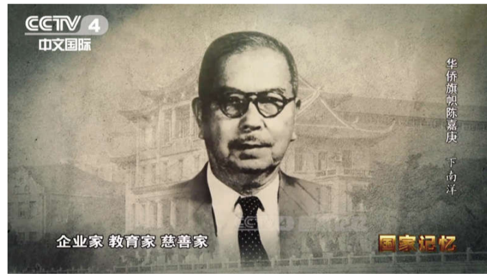
《国家记忆·华侨旗帜陈嘉庚》纪录片

每天堵车赶路，理公务、抓监督、管安全、陪学生、整材料、刷新闻、养宠物，劳形于案牍，停留于