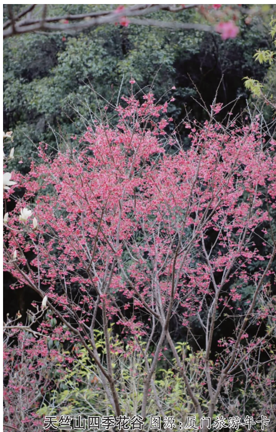
天竺山四季花谷