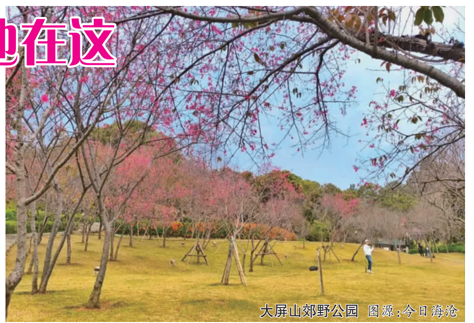
大屏山郊野公园