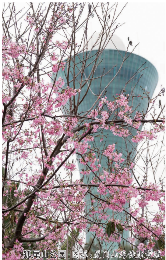
狐尾山公园 图源：厦门山海健康步道

在这个樱花盛开的季节里，不妨放下手中的忙碌，走进这些粉红花海，去感受春天的浪漫与温柔。（来源：厦门山海健康步道、今日海沧、厦门旅游年卡）