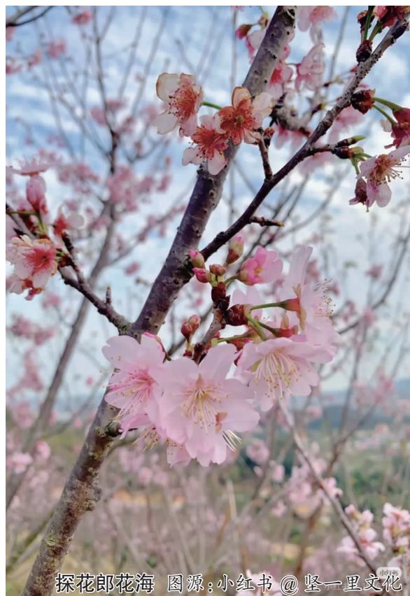
探花郎花海