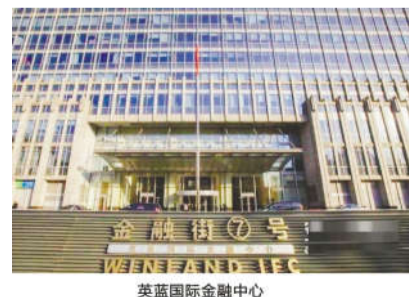
英蓝国际金融中心

英蓝集团是国内唯一专注于国际金融中心规划、投资、建设、招商、运营、管理、服务的企业。其自持运营的北京英蓝国际金融中心,被誉为北京金融街国际化的标志,已有高盛、摩根大通、瑞士银行、伦敦证交所等48家全球重要金融机构入驻,是国际金融机构中国总部的聚集区。