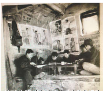
1956年春，参加北京农业合作化运动