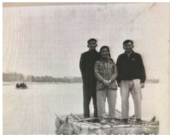
和归侨同学在兰州乘羊皮筏横渡黄河

当我们庆祝香港回归祖国22周年的时候，我对香港的前途充满信心。在强大祖国的支持下，在“一带一路”构想指引下，香港