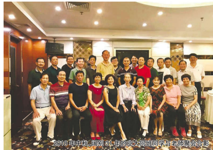
2013年中秋，阔别31年的业大同班同学与老师聚会合影