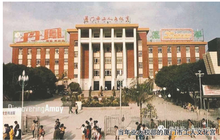
当年业大校部的厦门市工人文化宫

薪离职离开了工人岗位，来到了三资企业“金宝酒店”，步入了人生的新旅途——旅游行业。