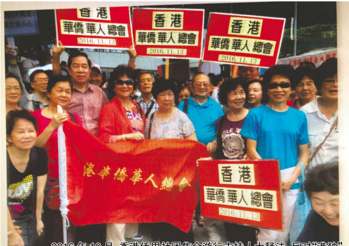
2016年10月，香港侨界社团集会游行支持人大释法，反对“港独”