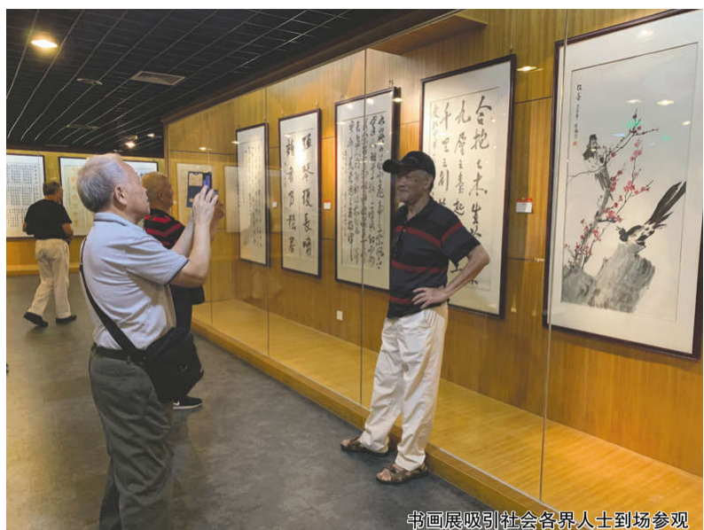
书画展吸引社会各界人士到场参观