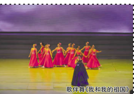
歌伴舞《我和我的祖国》