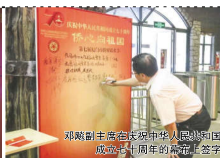
邓飏副主席在庆祝中华人民共和国成立七十周年的幕布上签字