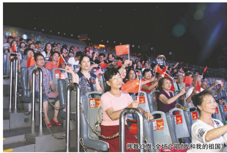
挥舞红旗,全场合唱《我和我的祖国》