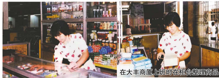
在大丰商厦上班时在柜台整理商品

我自梦：那南湖红船、井冈旌旗、皑皑雪山、泥泞草地、延安宝塔；那北国飘香的麦穗、南国早春