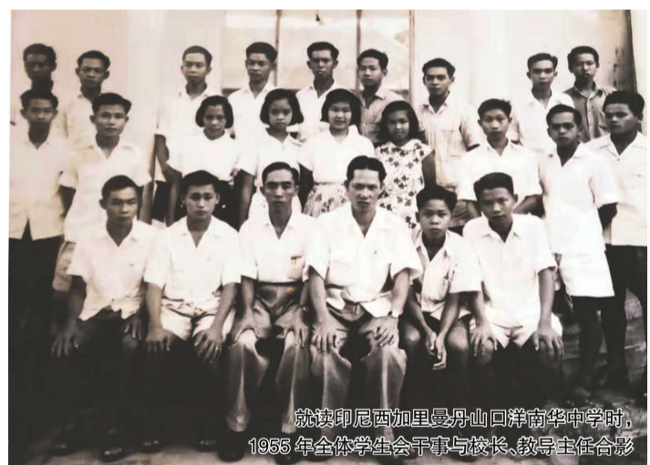
就读印尼西加里曼丹山口洋南华中学时，1955年全体学生会干事与校长、教导主任合影

1957年，怀着对祖国的深深思念和对青春理想的梦，我告别了养育我20年的父母，告别我生长的第二故乡印度尼西亚，踏上了回祖国的路。