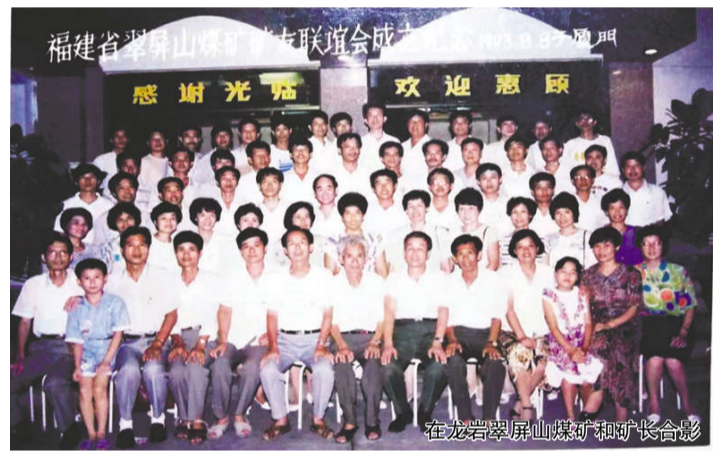
在龙岩翠屏山煤矿和矿长合影

我坚信，有广袤富饶的锦绣江山，有睿智思强，锐意追梦的英雄儿女，有久经考验的光荣伟大的中国共产党的核心力量，有习近平新时代中国特色社会主义思想的正确指引，中华民族要昂首挺胸屹立于世界民族之林，伟大复兴的中国梦必定要实现！