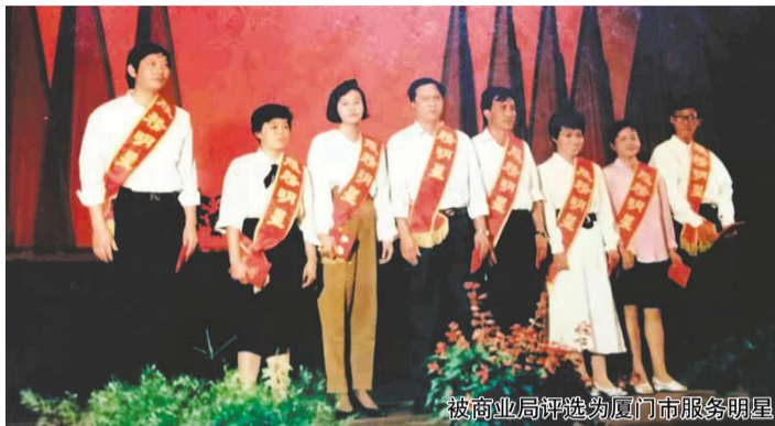
被商业局评选为厦门市服务明星