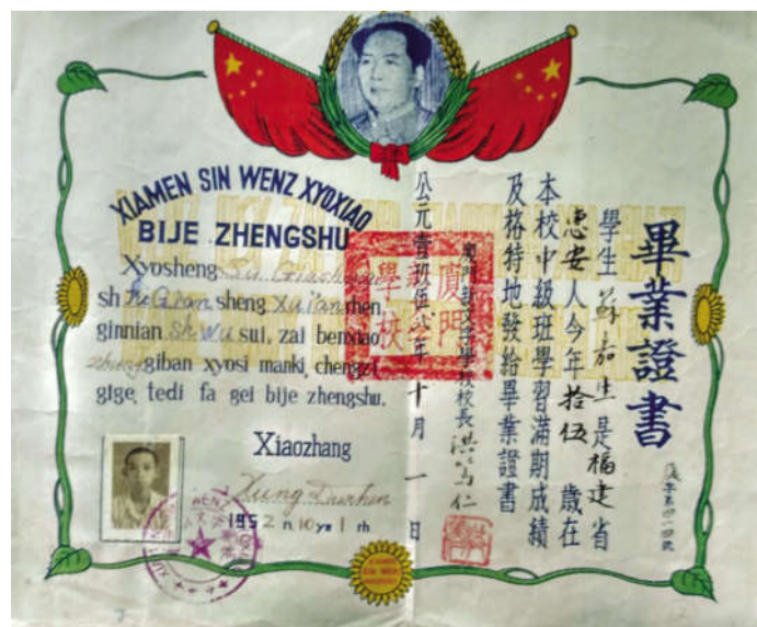
厦门新文字学校当年颁发的毕业证书