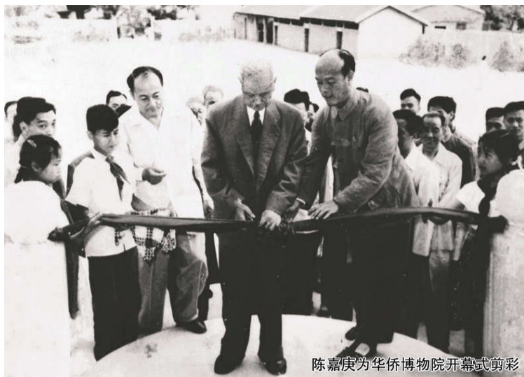
陈嘉庚为华侨博物院开幕式剪彩