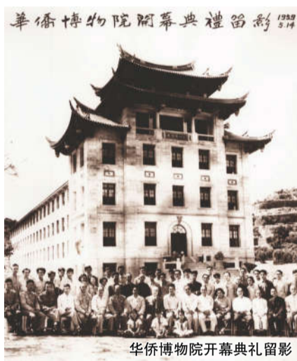
华侨博物院开幕典礼留影