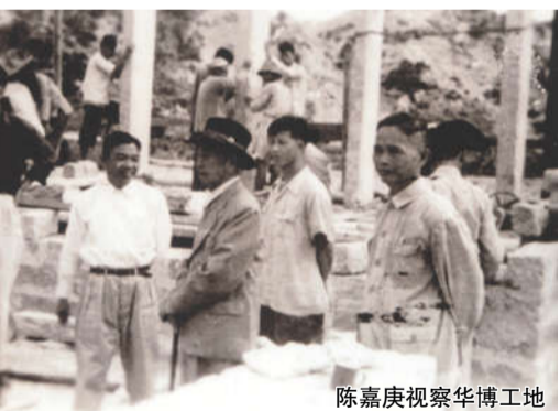
陈嘉庚视察华博工地

陈嘉庚1874年生于厦门集美。他一生致力于教育和社会公益事业,是著名爱国华侨领袖、企业家、教育家、慈善家、社会活动家,被誉为“华侨旗帜,民族光辉”。2014年起,厦门将每年10月定为“嘉庚精神宣传月”。厦门还将地铁1号线列车组命名为“嘉庚号”,以纪念陈嘉庚。