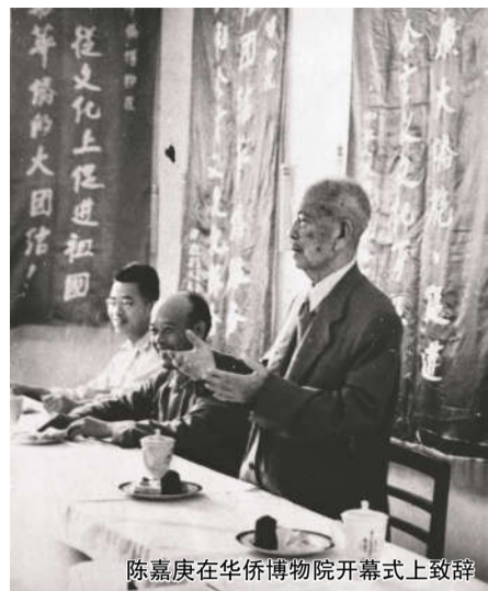
陈嘉庚在华侨博物院开幕式上致辞