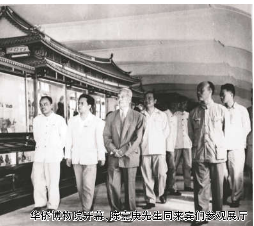
华侨博物院开幕,陈嘉庚先生同来宾们参观展厅