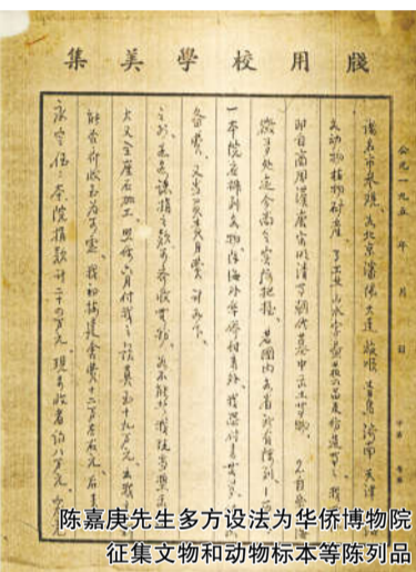
陈嘉庚先生多方设法为华侨博物院征集文物和动物标本等陈列品