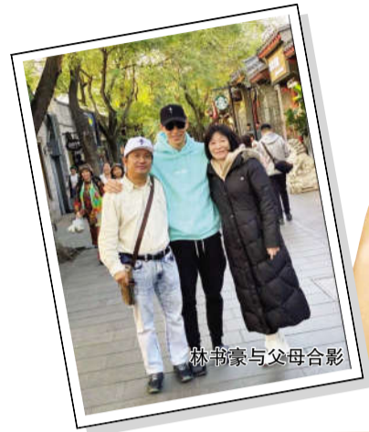
林书豪与父母合影