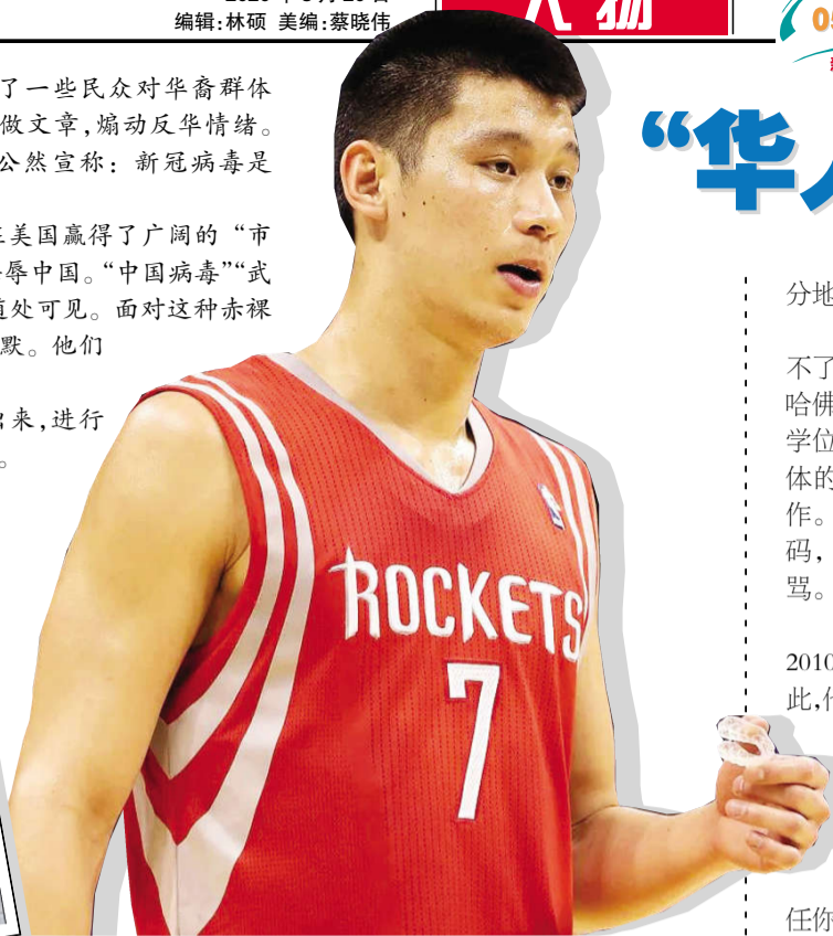
林书豪曾加盟火箭队