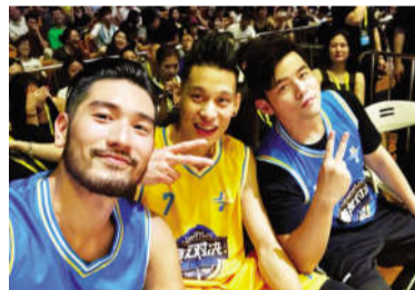
林书豪与高以翔、周杰伦

林书豪的NBA生涯,过得依然十分艰辛。在赛场上,对手会经常挑衅。他们说一些种族歧视的语言,企图激怒林书豪。林书豪必须不断提高自己的心理素质,才能不被刺激得发挥失常。