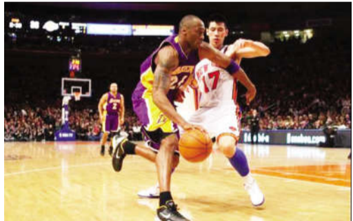
科比和林书豪狭路相逢