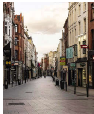
爱尔兰空荡荡的街道