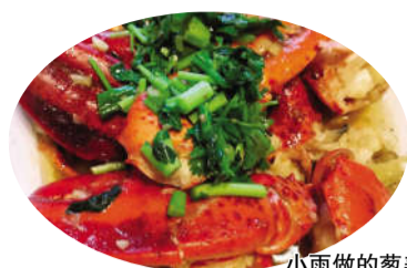
小雨做的葱姜炒龙虾