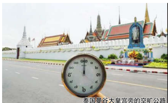
泰国曼谷大皇宫旁的空旷公路

可以看出,各地的旅游行业都在期盼着更多游客的到来。相信当疫情的“阴霾”消散而去,旅游业的“寒冬”终会成为过往,新的相逢会将“温暖”延续。(转载自日本《中文导报》、《欧洲时报》、美国中文网等)