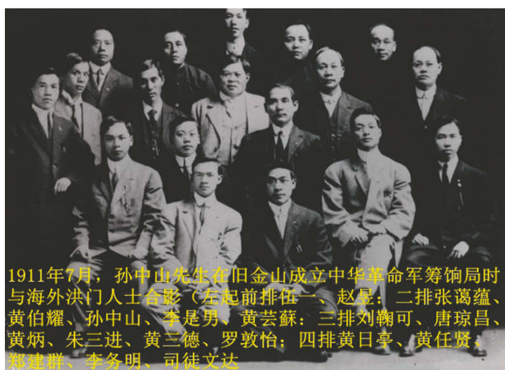
1911年7月,孙中山先生在旧金山成立中华革命军筹饷局时与海外洪门人士合影(左起前排伍一、赵昱;二排张霭蕴、黄伯耀、孙中山、李是男、黄芸苏;三排刘鞠可、唐琼昌、黄炳、朱三进、黄三德、罗敦怡;四排黄日亭、黄任贤、郑建群、李各明、司徒文达)

武汉首义,海外人心大为振奋。虽筹饷局已告结束,但各处洪门弟兄及同盟会会员仍努力捐输,影响各界华侨亦纷纷输将。有的一人捐几百元者,也有人捐几千元者,甚至一人捐几万元者。所捐款项有汇至南京总统府者,有汇至上海军政府者,亦有汇至福建军政府者,有汇广东军政府者。当时海外各地华侨,万众一心,争相捐输,空前踊跃。 孙中山倡导革命之初,筚路蓝缕,艰苦备尝,即一饭一宿,亦常见拒于人。当时困难之际,海外洪门人士及华侨中毁家纾难、投笔从戎者,大有人在。革命军兴,华侨捐输,靡役不与;每次举义失败,不为之气馁,反益增国难家仇之感,捐输益形积极。故孙中山缅怀往昔,不禁感慨系之,喟然叹曰:“华侨乃革命之母也!”