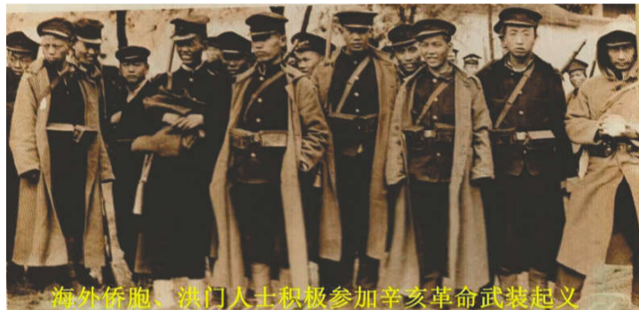
海外侨胞、洪门人士积极参加辛亥革命武装起义

1911年,广州三月二十九日之役不幸失败,殉难烈士慷慨捐躯,感动全国,革命浪潮日益汹涌澎湃,海外华侨捐输亦更加积极。 孙中山看到三月二十九日之役失败,牺牲同志甚众,乃奋起赴各地宣传。孙中山始终坚信:“我不管革命失败了有多少次,但是我总要希望中国的革命成功,所以不能不总是这样奋斗”。同年夏天他重赴旧金山,在洪门致公总堂的支持下,于丽婵戏院召开演讲会,竭力宣传革命,并亲自奔赴美西葛仑、士得顿等各埠华侨农场,向侨胞演讲革命。当时由同盟会会员赵昱、刘鞠可陪同前往,晚间他们同宿于农场木屋中,赵、刘睡在孙中山床边之地板上,以作护卫。孙中山赤心为国,至诚动人,洪门人士、广大侨胞大为感奋,纷纷加入同盟会。