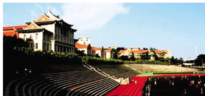
厦门大学建南大礼堂

李光前在陈嘉庚的谦益公司工作10年后，自创公司，不过他仍对陈嘉庚的公司及私人业务，始终如一地进行协助和支持；而且他一生常以陈嘉庚为榜样，并继承和发扬陈嘉庚热爱祖国、热爱桑梓、热心文化教育事业及慈善福利事业的优良传统。对于李光前来说，与岳父陈嘉庚有知遇之情、翁婿之情，亦有朋友之情，他更是陈嘉庚精神不折不扣的传承者之一。在事业上与陈嘉庚默契配合，在精神上是师承关系，李光前能成为继陈嘉庚之后又一位以倾资兴学而彪炳青史的商界人物，这在中国近现代商业历史及华侨史上都是空前未有的。