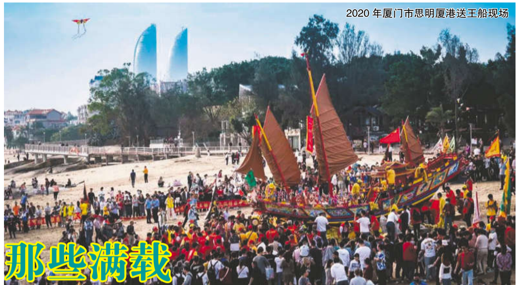
2020年厦门市思明厦港送王船现场

由于南音富有独特的民族风格和浓郁的乡土气息,具有曲调优美、易学易唱的特点。随着闽南人外移,南音早已“声扬台湾宝岛,誉满客地南洋”,成为海外侨胞、台港澳同胞维系乡情的精神纽带。