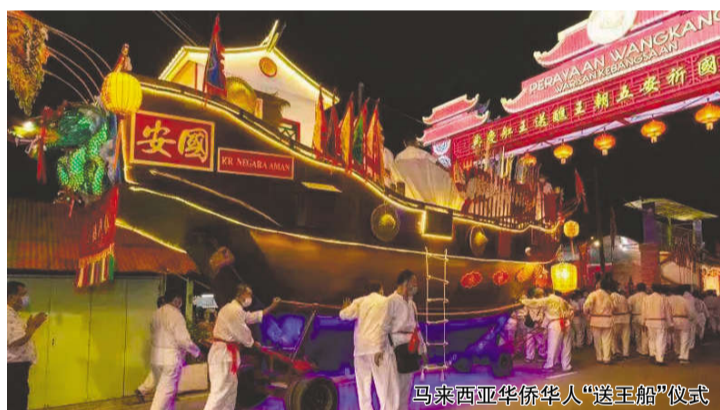
马来西亚华侨华人“送王船”仪式

送王船有其特定的自然和人文环境,其所承载的传统知识和民间智慧丰富了当前社区的生活世界,贯穿着有关风险和灾难的持续性反思。