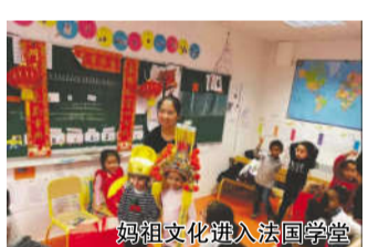
妈祖文化进入法国学堂

2019年11月,湄洲妈祖金身巡安新加坡、马来西亚、菲律宾、泰国等海丝沿线国家和地区,吸引了当地华侨华人和妈祖敬仰者近千万人次参与。