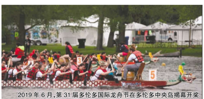
2019年6月,第31届多伦多国际龙舟节在多伦多中央岛揭幕开桨

元化。在中国参加过龙舟赛的美国人把这一活动带回美国。如今美国已有数百只龙舟队。哈德逊河上的龙舟比赛已成为纽约华人社区每年最盛大的活动。