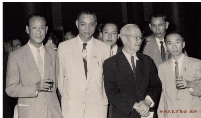
陈嘉庚(左三)和孙炳炎(左二)等。1956年摄于北京

以民间特有的渠道和方式促进两岸关系和平发展、推动祖国和平统一的考量。1996年在同安召开的第二届世同大会,来自20多个国家和地区的44个代表团中,就有12个来自台湾,会上倡议的由厦门莲花水库向金门供水的建设项目,在台湾同胞中引起了强烈反响。2013年,第九届世界同安联谊大会在台北市成功举办,对进一步扩大海峡两岸的经贸合作和交流,促进祖国和平统一起到了重要的推动作用。