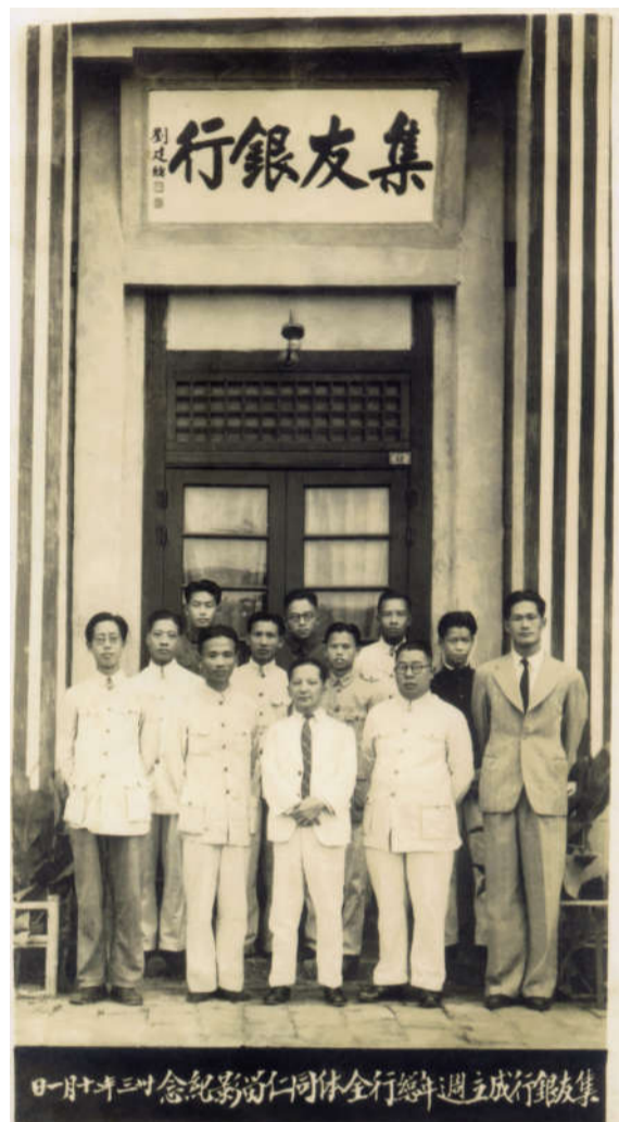
集友银行成立周年总行全体同仁合影纪念(1944年)

秉承陈嘉庚一贯以来“以产养学”的经营策略,陈嘉庚长子陈济民、次子陈厥祥,以及时任校董会董事长陈村牧等人,将新加坡汇来的800余万元分作三部分使用,主要用于投资中国药产提炼股份有限公司、开设集友银行和集美实业股份有限公司等。