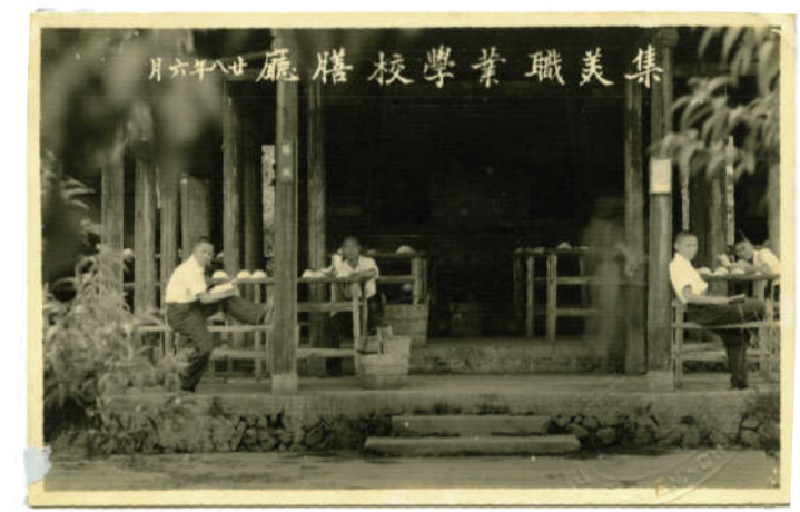
集美职业学校膳厅(福建大田-1939.6)

1937年至1940年,学校先后播迁多处,人员运输、修葺增筑、器具添置,种种事项无一不需耗费。在此期间,财务状况虽然吃紧,但由于物价尚未大幅上涨,且陈嘉庚多方筹措,仍坚持按月汇来5000元至13000元不等的校费,因此尚能基本维持着收支平衡。