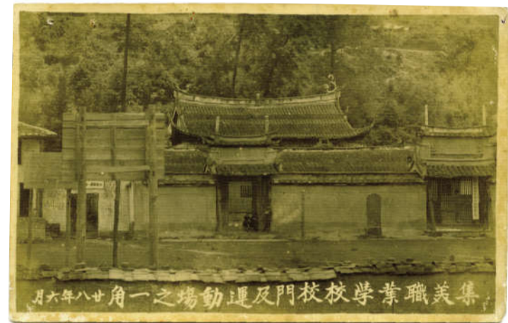
集美职业学校校门及运动场之一角(福建大田-1939.6)

1937年前,集美学校的运行发展,几乎完全倚赖陈嘉庚一己之力。截至1933年,学校经常费、建筑费计用462.3万余元,推广教育费计用19.2万余元,均由其独立供给。其后,南洋经济景况惨淡,陈嘉庚的企业连年亏损,终于1934年收盘。自此他不得不向友人、族亲筹募,甚至以厂房、地产、货物等作为抵押举债贷款,以填补集