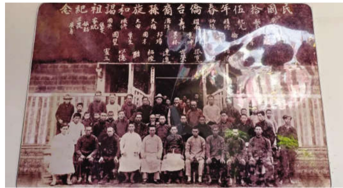
赖氏家庙里的台湾宗亲合影