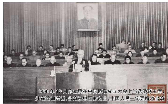
1956年10月陈嘉庚在中国侨联成立大会上当选侨联主席,并在致词时说:台湾是中国的领土,中国人民一定要解放台湾

陈嘉庚最后的遗言“台湾必须归中国”表达了他对台湾回归中国的殷切盼望,相信他的这个愿望一定会实现。