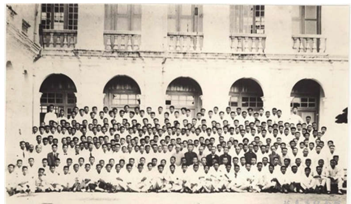
陈嘉庚(3排右11)与集美学校师生合影