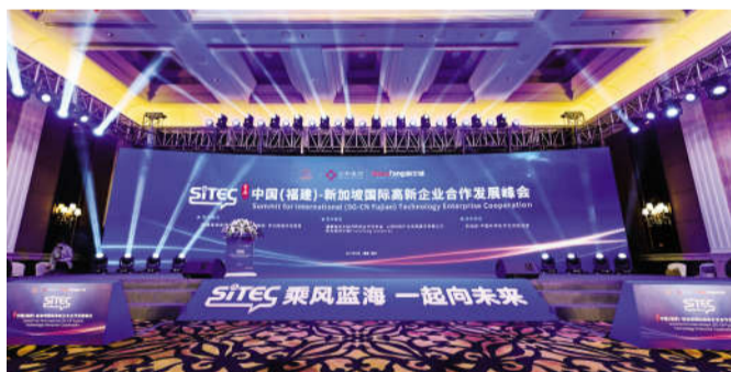
SITEC中国(福建)-新加坡国际高新企业合作发展峰会

2022年,创士锋与苏州工业园区密切合作,运营新加坡苏州商务中心;与北京中关村发展集团合作,支持集团在新加坡的海外联络点。同年,创士锋与中科院曼谷创新中心、上海新微创源和上海均和产业发展集团合作,建立创士锋上海运营中心。并在福州闽侯县和中国银行福州分行的支持下,创士锋与上海均和产业发展集团联合成立中新高新企业合作(福州)基地。