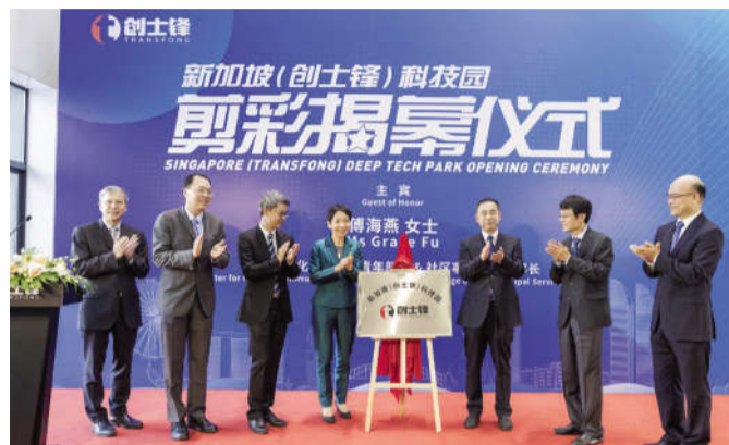
新加坡创士锋揭幕,中新领导参与剪彩