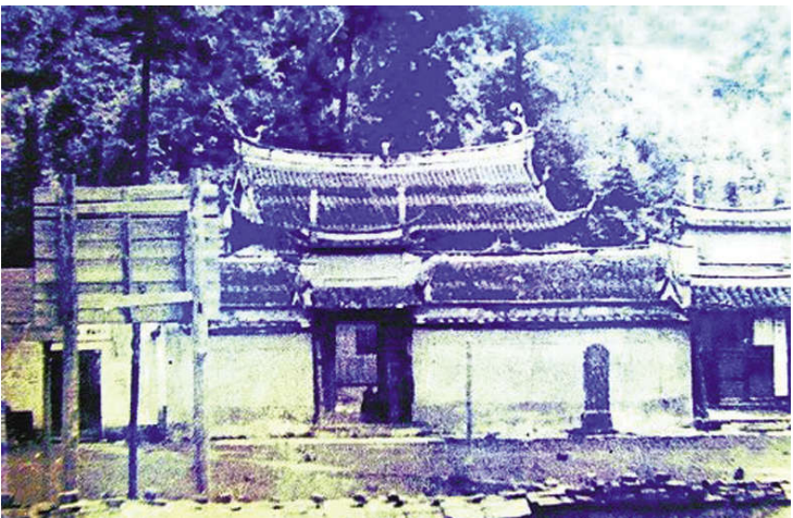
抗战期间,私立集美职业学校内迁到大田县,在敌军的轰炸下坚持上课。

抗战胜利后,各校相继复员,迁回集美,直到1946年全部迁回厦门,结束了这段校史上最艰难困苦的播迁时期。集美学校一边加紧修葺校舍,努力恢复旧观;一边加强校务管理,重视教学质量。各校励精图治,在极为困难的情况下,保证了办学质量。