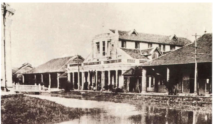
原集美学校礼堂。