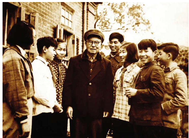
陈嘉庚与集美华侨学生补习学校学生在一起。

1949年9月23日,集美解放,集美学校迎来新生。在陈嘉庚亲自主持下,集美学校积极修复被战火毁坏的校舍,同时又进行了大规模的扩建。学校迅速得以恢复并有很大发展,新办了水产商船专科学校。