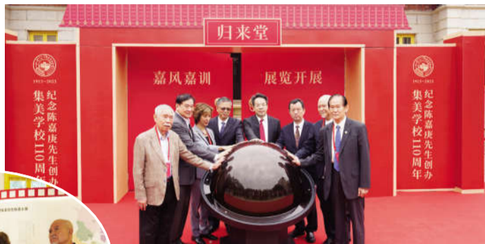
归来堂复原工程竣工仪式