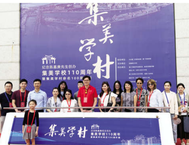
“集美学村——纪念陈嘉庚先生创办集美学校110周年暨集美学村命名100周年”展览开幕式

当天,《厦门集美学村》和《集美学校校史(2013-2023)》两本书举办首发仪式。文史丛书《厦门集美学村》由厦门市政协牵头,联合厦门市集美区政协、集美学校委员会共同发起编写,从历史、风物、人文的视角,博采约取,整合提炼,用“学村缘起”“百年沧桑”“庠序雍穆”“人文荟萃”四章来呈现百年集美学村、百年集美学校的前世今生、沧海桑田。由集美学校委员会和集美校友总会联合编撰的《集美学校校史(2013-2023)》一书,记录了集美各校新百年、新十年嘉庚精神的传承赓续,总结了嘉庚教育事业发展的成果,记录了嘉庚弟子的光辉足迹。