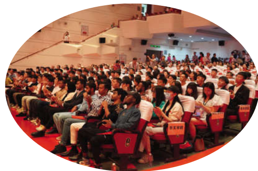
海内外集美校友嘉宾齐聚一堂

一张靓丽名片。当前,厦门市凝心聚力建设“两高两化”城市,更好地为中国式现代化探索试验、探路先行,积极建设两岸融合发展示范区,衷心希望此次全球集美校友大联欢,成为校友们激励青春梦想、分享成长收获、促进交流合作的大舞台。