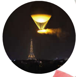
7月26日,主火炬点燃后热气球升空。