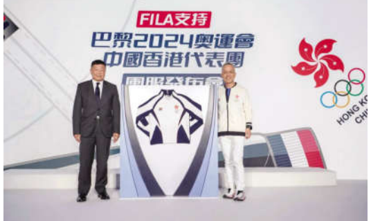
中国香港代表团出征团服