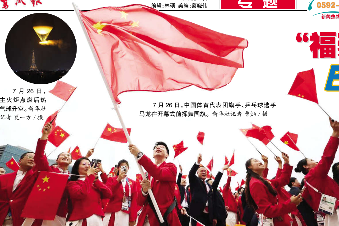
7月26日,中国体育代表团旗手、乒乓球选手马龙在开幕式前挥舞国旗。