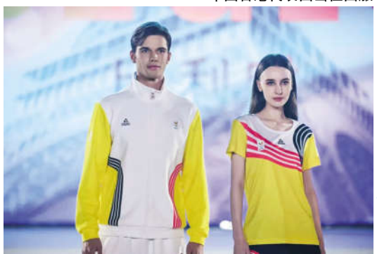
比利时代表团比赛服