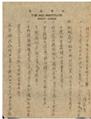
陈嘉庚先生关于废弃泥沙再充分利用的书信

他在给陈永定的一封信中提到对于工地上产生的废泥沙不能简单丢弃了事,而是要将其中可以使用的细沙土筛出来再利用,剩下的废料再做清理。